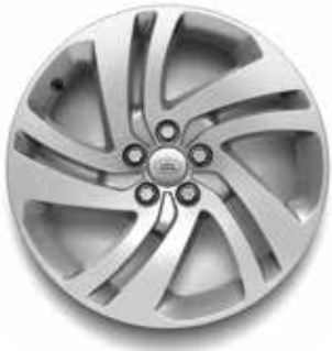
18" MIT 5 DOPPELSPEICHEN (STYLE 5074) SILVER Serienausstattung für S