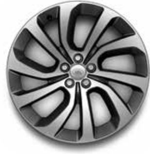
20" MIT 5 DOPPELSPEICHEN (STYLE 5089) GLOSS DARK GREY, CONTRAST DIAMOND TURNED