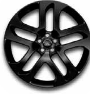
21" MIT 5 DOPPELSPEICHEN (STYLE 5078) 2 GLOSS BLACK