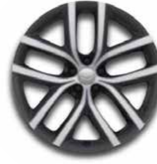
19" MIT 5 DOPPELSPEICHEN (STYLE 5136) GLOSS DARK GREY, CONTRAST DIAMOND TURNED Serienausstattung für Dynamic SE