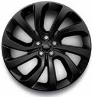
20" MIT 5 DOPPELSPEICHEN (STYLE 5089) GLOSS BLACK