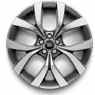
20" MIT 5 DOPPELSPEICHEN (STYLE 5076) 1 GLOSS MID-SILVER, CONTRAST DIAMOND TURNED Serienausstattung für Dynamic HSE