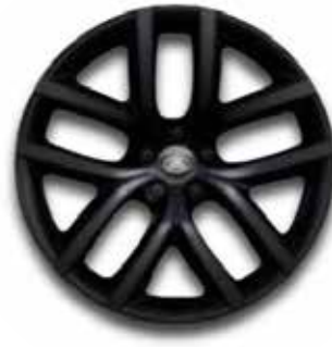
19" MIT 5 DOPPELSPEICHEN (STYLE 5136) GLOSS BLACK