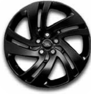
18" MIT 5 DOPPELSPEICHEN (STYLE 5074) GLOSS BLACK