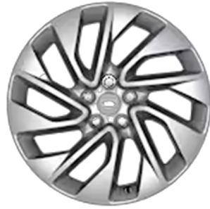
20" MIT 5 DOPPELSPEICHEN (STYLE 5122) 1 GLOSS SILVER Serienausstattung für Dynamic S