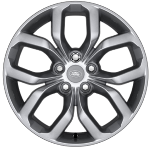
19" MIT 5 DOPPELSPEICHEN (STYLE 5021) 1 SPARKLE SILVER