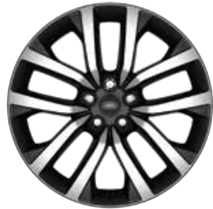
21" MIT 5 DOPPELSPEICHEN (STYLE 5123) 2 GLOSS DARK GREY, CONTRAST DIAMOND TURNED