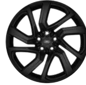
21" MIT 5 DOPPELSPEICHEN (STYLE 5025) GLOSS BLACK Serienausstattung für Dynamic SE