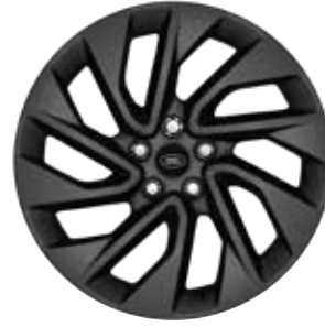
20" MIT 5 DOPPELSPEICHEN (STYLE 5122) 2 SATIN DARK GREY