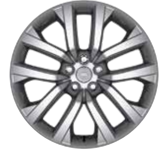
21" MIT 5 DOPPELSPEICHEN (STYLE 5123) 3 GLOSS SILVER Serienausstattung für Commercial SE