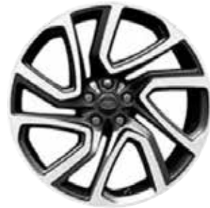
22" MIT 5 DOPPELSPEICHEN (STYLE 5025) SATIN DARK GREY, CONTRAST DIAMOND TURNED