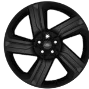
22" MIT 5 DOPPELSPEICHEN (STYLE 5124) GLOSS BLACK Serienausstattung für Dynamic HSE und Commercial Dynamic HSE