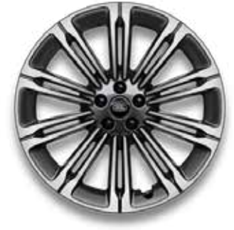
23" MIT 10 DOPPELSPEICHEN (STYLE 1075) 1 GLOSS DARK GREY CONTRAST, DIAMOND TURNED